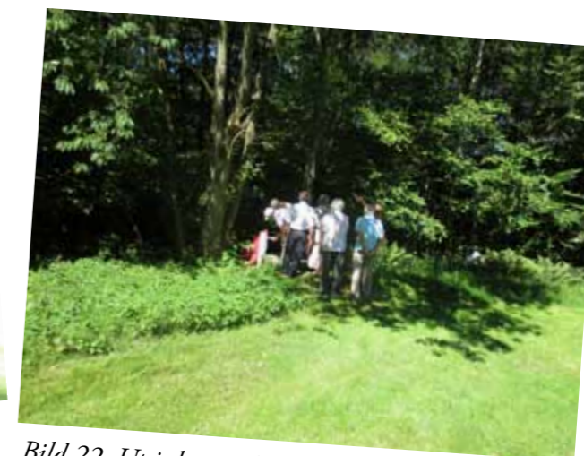
Bild 22. Ut i skogen ska vi gå ...