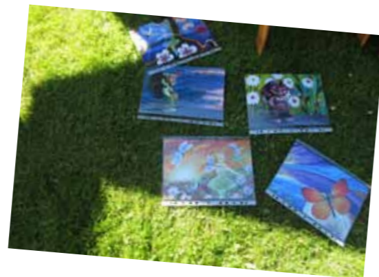
Bild 29–30. Tipsrundepriser skapade av fotografen och konstnären Kjell Wihlborg.