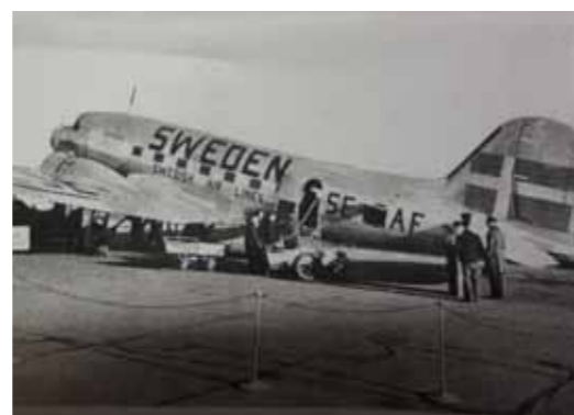
Bild 32. Stora svenska flaggor målades under kriget över fena och sidoroder och nationsnamnet på flygkroppen för att umärka våra neutrala trafikflygplan.