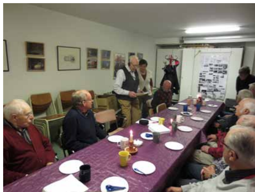
Bild 31. Föredragshållaren (stående), som inte var bunden av manuskript, tittar dock här i sina papper, medan åhörarna lyssnar intresserat.